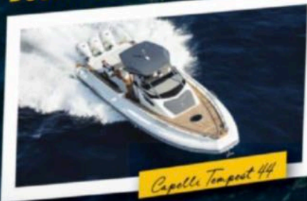
Capella Tempest 44

BOSPHORUS BOATSHOW KARA FUARININ LANSMAN TEKNELERİ