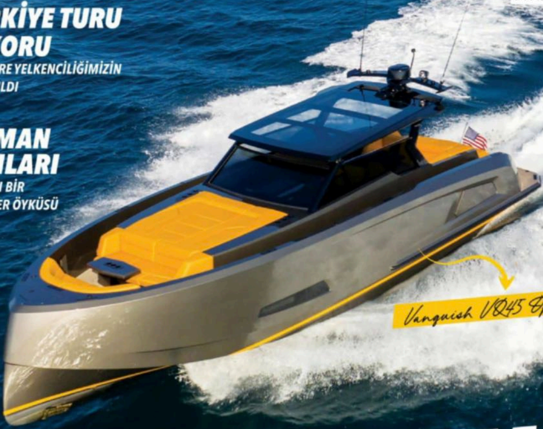
Vanquish VQ45 Open