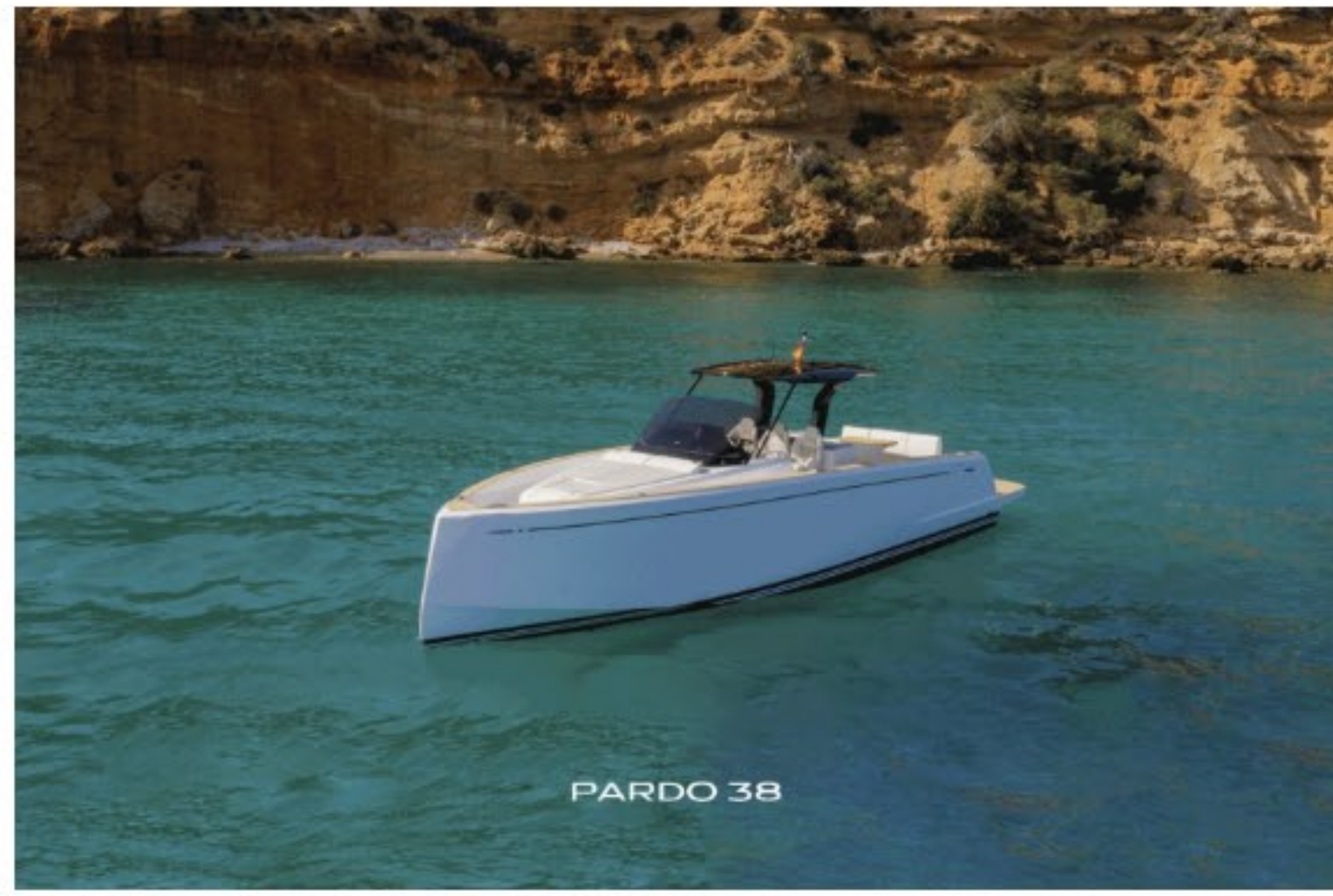
Pardo Yachts al Salone Internazionale di Genova